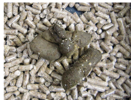
Figura 4: Feci ben formate e di colore normale dopo 4 settimane di utilizzo della dieta Feline EN (G60).

includere tutte le enteropatie derivanti da allergie o intolleranze alimentari. La loro diagnosi dipende dalla scomparsa dei segni clinici in seguito a un cambiamento di dieta. Tale cambiamento può essere relativamente immediato e consistere nella semplice sostituzione della dieta corrente con una di qualità superiore: ad esempio, passare da un alimento a marchio del supermercato a una dieta di qualità OPPURE da una dieta di qualità a un'altra, la cui formula sia indicata per disturbi gastrointestinali (Feline EN di PURINA VETERINARY DIETS®), OPPURE sostituire una dieta gastrointestinale con una ipoallergenica (Feline HA di PURINA VETERINARY DIETS®).