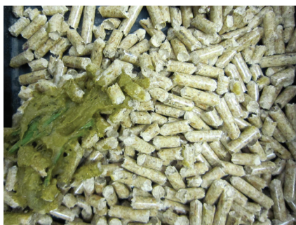
Figura 2: Feci molto molli e verdi (G0).