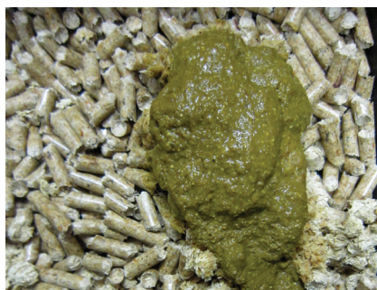
Figura 3: Feci molli e verdi dopo 4 settimane di antibiotici e dieta di mantenimento (G30).